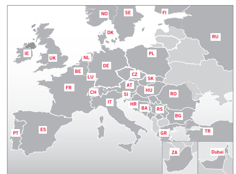
Avnet Technology Solutions EMEA is actief in meer dan 30 landen.

AMD, EIZO, Enterasys Networks, Hitachi, HP, IBM, Intel, Motorola, Oracle, Sun Microsystems